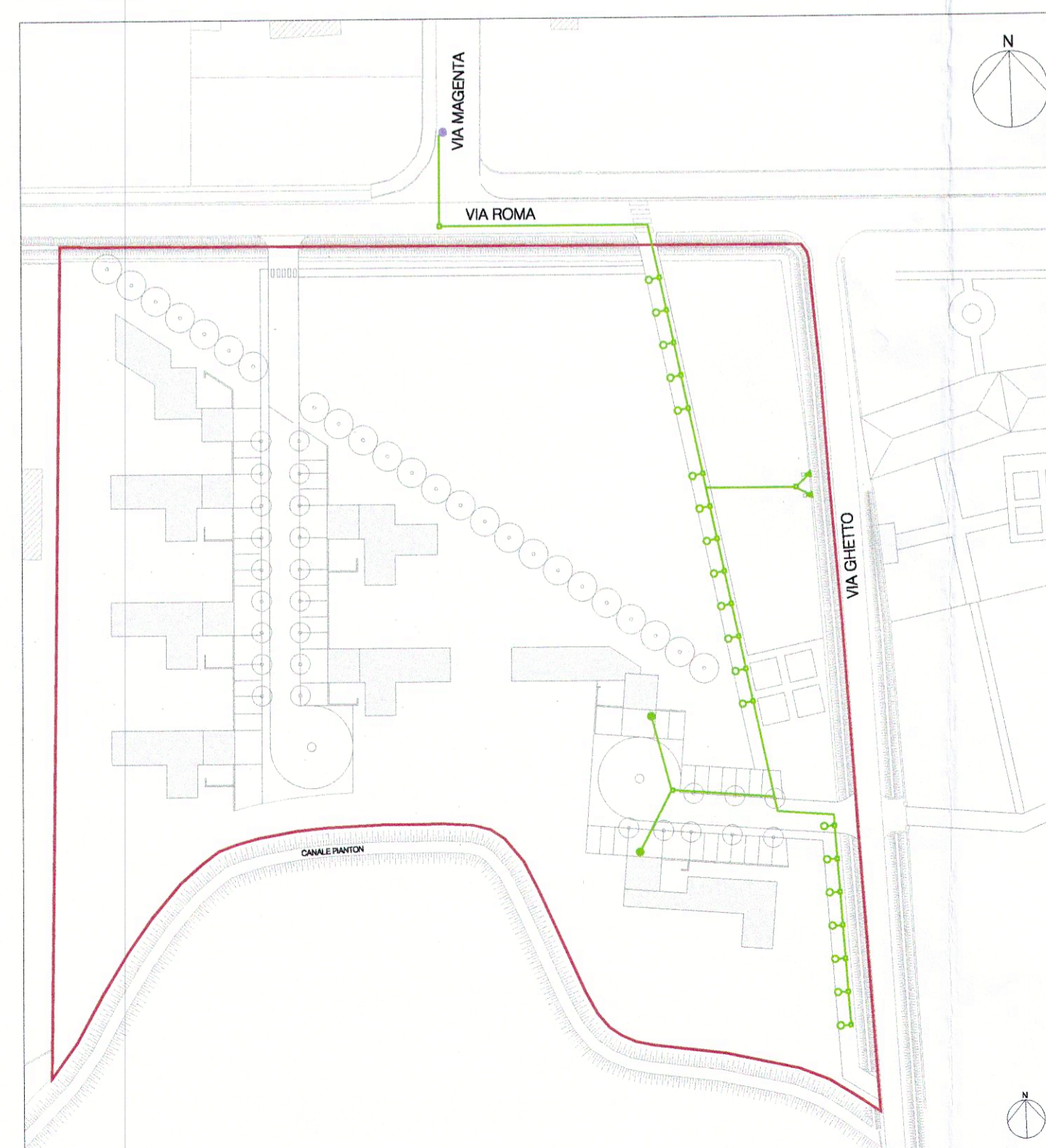
RETE ILLUMINAZIONE PUBBLICA