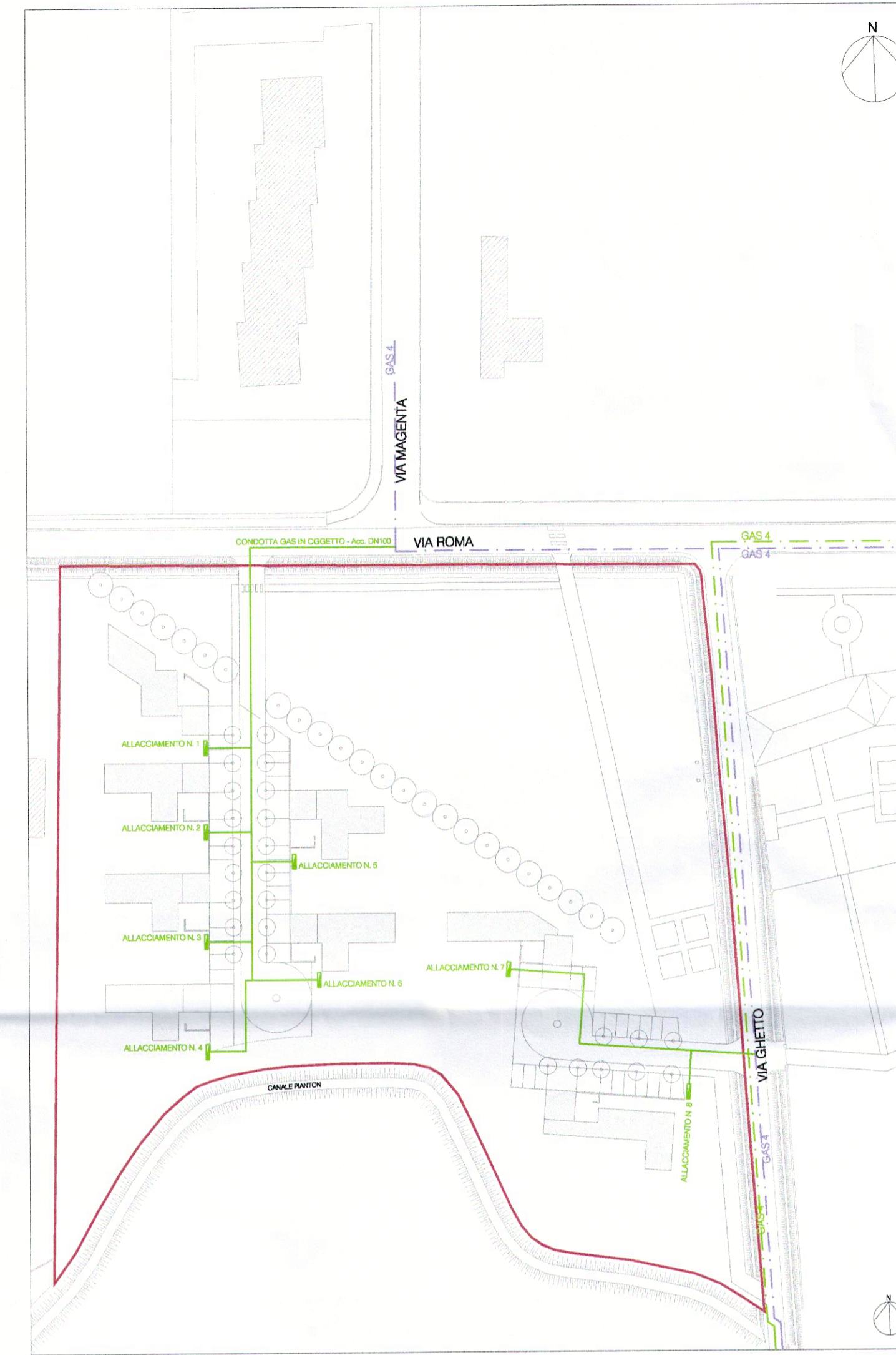
RETE GAS METANO